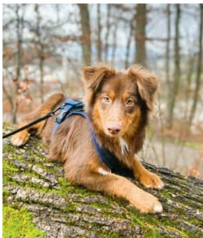
Im Mittelpunkt: Hündin Akiba

Ich bin der Gemeinde Ehrendingen sehr dankbar, dass ich die Möglichkeit bekommen habe, Akiba zu einem tollen Schulbegleithund auszubilden. Obwohl sie erst am Anfang ihrer langen Ausbildung steht, ist sie schon jetzt eine Bereicherung. Kinder und auch Erziehungsberechtigte reagieren auf Akiba sehr positiv. Kinder lassen sich schnell von ihr «trösten» und fühlen sich so gleich wohler. Die Gesprächskultur hält sich oft auf einer anderen Ebene, wenn Akiba dabei ist. Sie ist klar der Fokus aller und bringt viel Ruhe mit sich – was sich in Gesprächen dann positiv widerspiegelt.