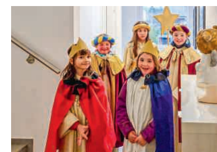
Mit dem Stern unterwegs