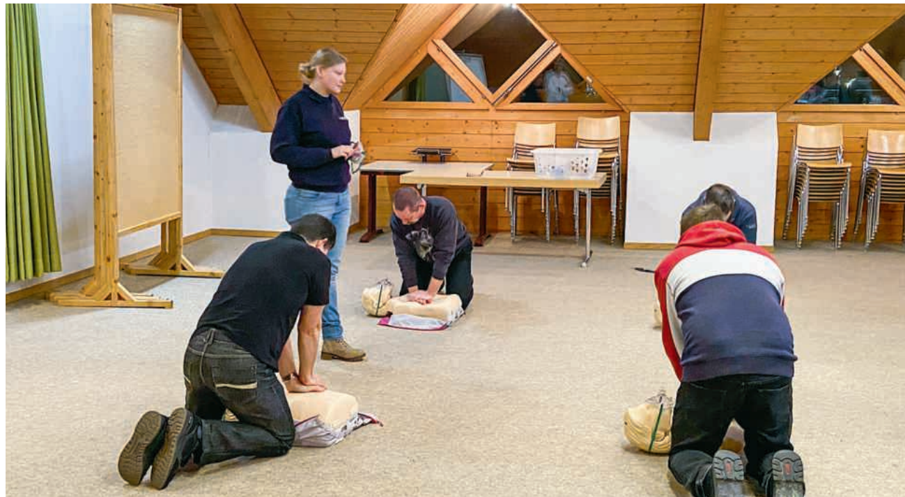
Angehende Mitglieder der First Responder Ehrendingen-Freienwil während der Ausbildung

Dass gewisse Einsätze teilweise unter die Haut gehen, ist nicht zu vermeiden. Dies nicht nur, was die Angehörigen der Betroffenen, sondern auch was die First Responder selbst angeht. Für das verantwortungsvolle